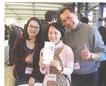
▲こんなに大勢の中で1等が当たってしまいびっくりです。今回、この同窓会に誘ってくれた友人に感謝です。