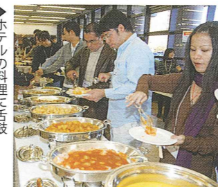
▶ホテルの料理に舌鼓