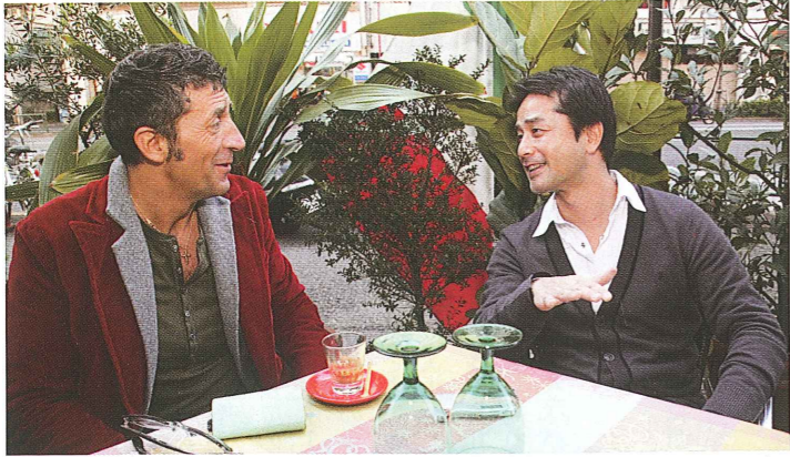
イタリア料理コチネッラ (目黒区青葉台 1-27-12 http://www.kikkos.net/)

北原 今の仕事はまさにそれじゃないですか。すごい、夢が叶ってる！ ジローラモさんにとって「元気の秘訣」は？